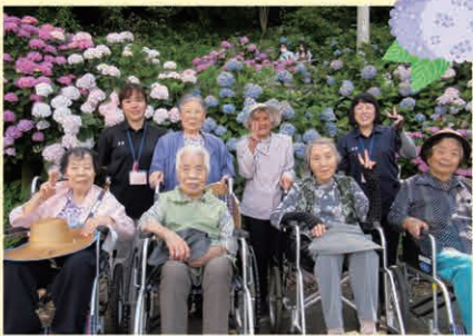
紫陽花見物 (宇土市住吉自然公園にて)