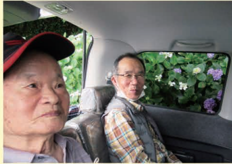
雨の日は車中にて、見物しました。