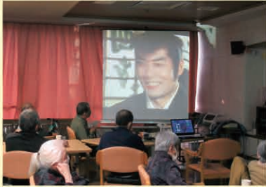
大型スクリーン での映画鑑賞