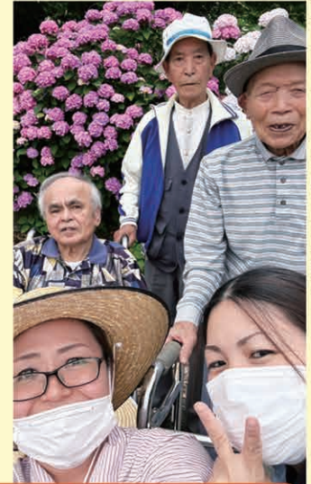
職員と一緒に、ハイポーズ!