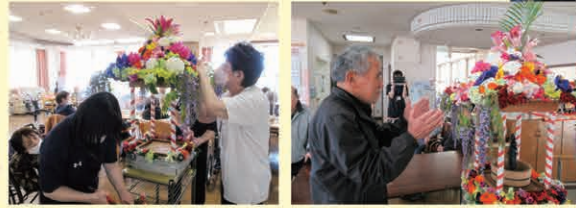
花まつりの風景(合掌)