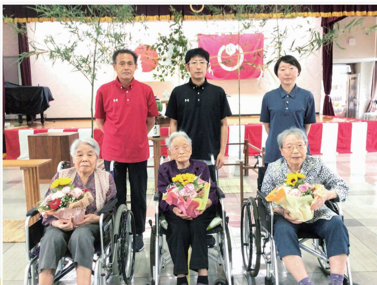
福寿祝(しらぬい荘にて) 「サテライト入居者様」