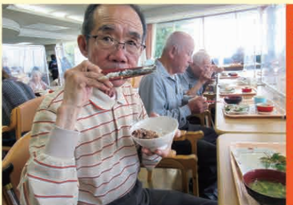
頭からガブリっと...