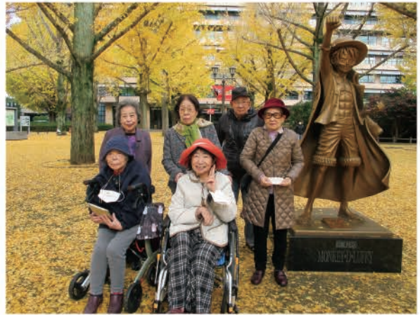
この日は空気が冷たく肌寒い陽気でしたが 銀杏の黄色い絨毯はとても綺麗でした