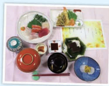
お刺身盛り合わせディナー