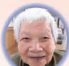
谷ロスエノ様 98歳 五木村 しらぬい荘