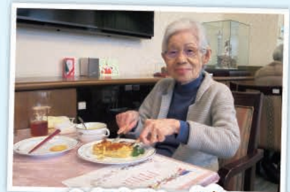
ナイフとフォークを 使いおいしいパイ焼きを いただきました