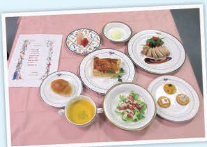
クリスマスディナー