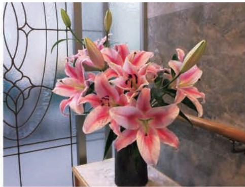
大輪のカサブランカ!