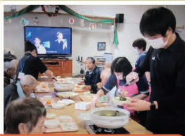
～利用者忘年会の様子～（鯛と鰯のお造り&ちゃんこ鍋）