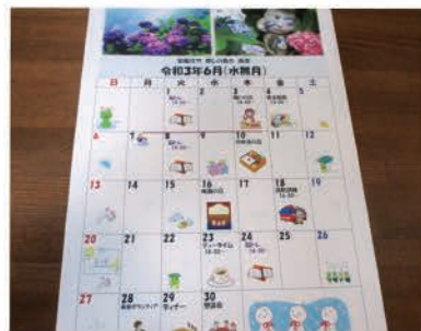
オリジナルカレンダー