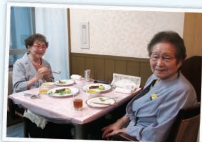
ステーキディナー