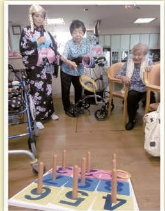
夏の恒例行事(すいか割り)・ゲーム大会(輪投げ)