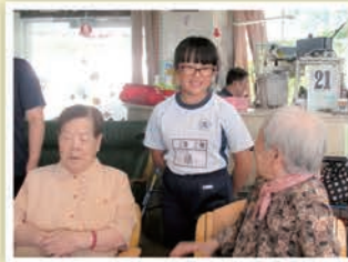
子供たちとの語らい(ワークキャンプ)