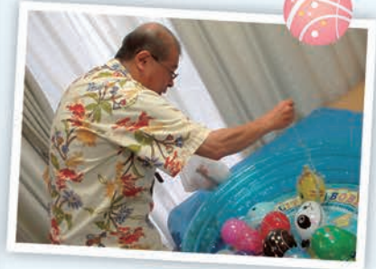
フーセンヨーヨー! ゲット