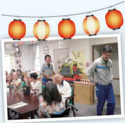
祭りだ! ワッショイ!!