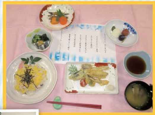
【きびなごづくしのディナー】