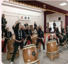
宇土高等学校 和太鼓部