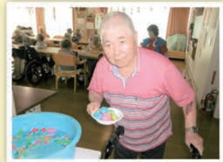
金魚すくいの風景(納涼祭)