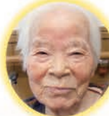
藤本スギ工様 95歳 小川町 しらぬい荘