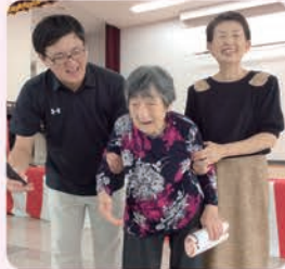
みんないい笑顔ですね!