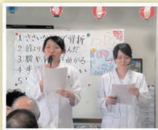
尚綱大学(左)・尚綱短大(右)の学生さんによる栄養講座