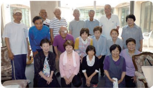
竹崎グラウンドゴルフ愛好会