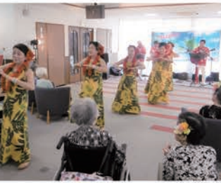
トランペット・ハワイアンの演奏(ボランティア訪問)