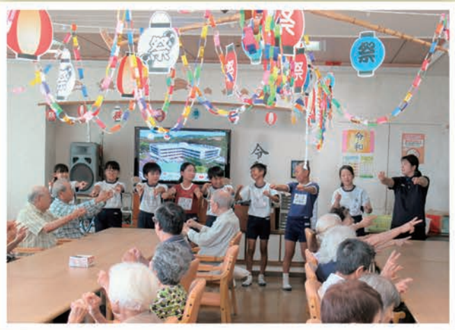
豊福小学生との交流(ワークキャンプ)

今年の夏も暑い日が続きましたね。みなさんいかがお過ごしでしたか?今号では、夏の恒例行事でもある「納涼祭」を行い、ご利用者の皆様も童心にもどられ楽しまれていました。その他では、「すいか割り」・「スタンプラリー」・「ボランティア訪問(トランペット・ハワイアン)」・「ワークキャンプ(豊福小学校の子供たちとの交流会)」・「栄養講座」等たくさんの行事があり、みなさんの笑顔をよく見ることができました。