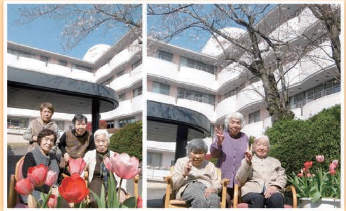
桜とチューリップの前で、みんなで記念撮影!