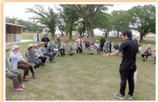
野外活動(旧自動車試験場)