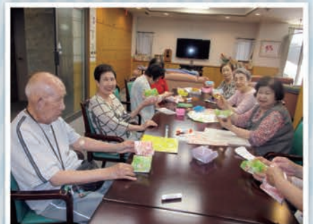
折紙 飾り台を作りました