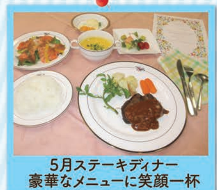
5月ステーキディナー 豪華なメニューに笑顔一杯