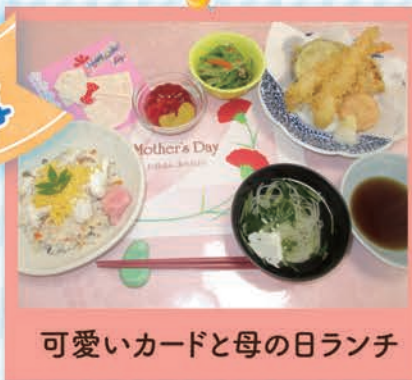
可愛いカードと母の日ランチ