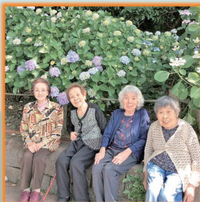
【しらぬい荘デイサービスセンター】 ～野外活動(バスハイク)住吉自然公園にて～