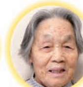
中山トキ工様 96歳 不知火町 しらぬい荘