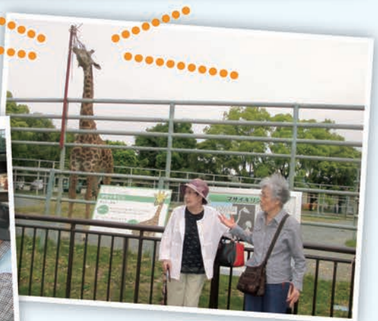
元気なキリンに会えました