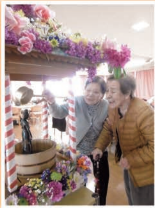
花まつりの風景 (お釈迦様に甘茶を!)