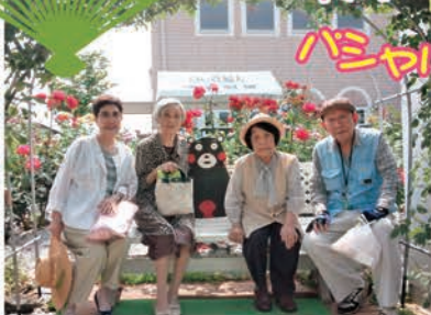
西区のフードパルへ薔薇見学に行きました。お天気にも恵まれ、 美味しいお茶も頂き皆さん大変喜ばれていました