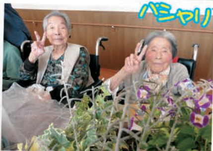
みなさんきれいに花を植える ことができ大満足でした