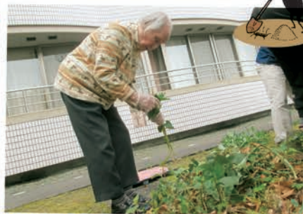
太陽の日差しに負けず、屋外での 園芸活動に取り組まれました