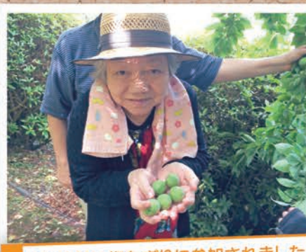
2年連続で梅ちぎりに参加されました