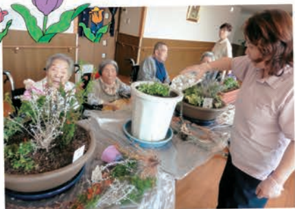
たくさんの花を植えてきれいに 飾り心も明るくなりました