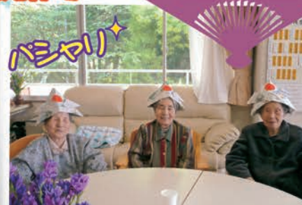
身の安全と健康を願って兜を作りました