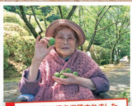
たくさんの梅を収穫されました