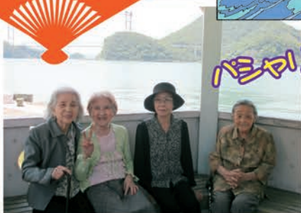
潮の香りはいつもとちがう感じて いい気分転換になりました♪