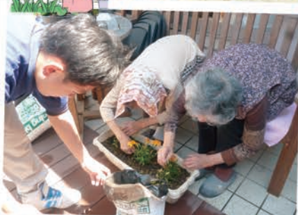
丁寧に苗を植えました。今後綺麗な花に育っていくのが楽しみです♪