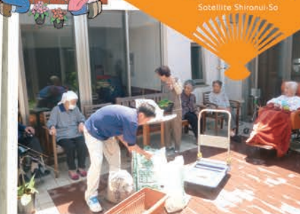
小スペースでも楽しめるガーデニングにトライしてみました♪