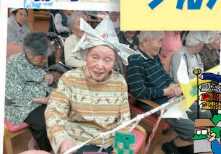
兜をつけ勇ましい飾りをして 男の子の誕生と成長を祝いました!