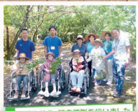
収穫を終え、記念撮影を行いました