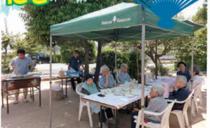
この日は五月晴れで、外で食べる昼食は一層おいしいです