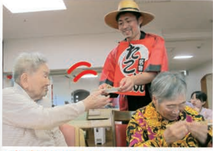
出来たてあつあつのたこ焼きは とても美味しかったです