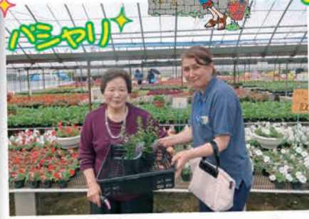
きれいな花を見るとつい置いたくないです