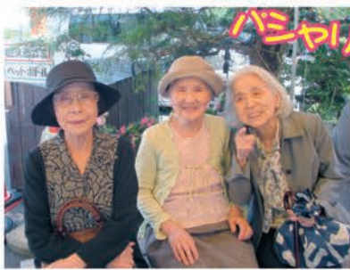
藍の天草村にて♪ たくさんの特産物があり面白い物を楽しみました!