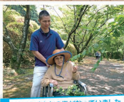
枝にたくさんの梅がなっていました

平成二十七年五月二十七日、しらぬい荘玄関前の並木坂にて梅ちぎりを実施しました。 毎年、五月の下旬に利用者様と職員でたくさんさんの梅を収穫しています。今年は、多くの利用者様