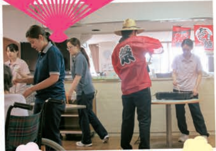
こがさないように、丁寧にやきました!