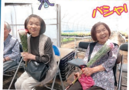
農園開放に合わせて、きれいな花々を観に行きました