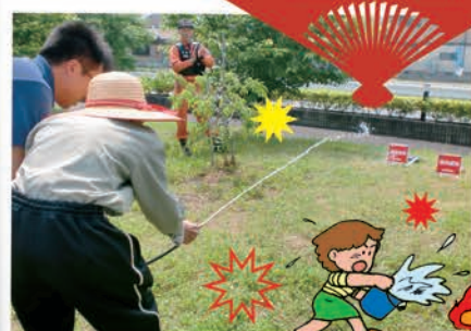
火事を想定し放水体験を行いました。無事に消火完了!!