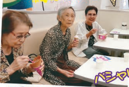
下通りのサーティーワンです。 暑い日にはアイスが最高!